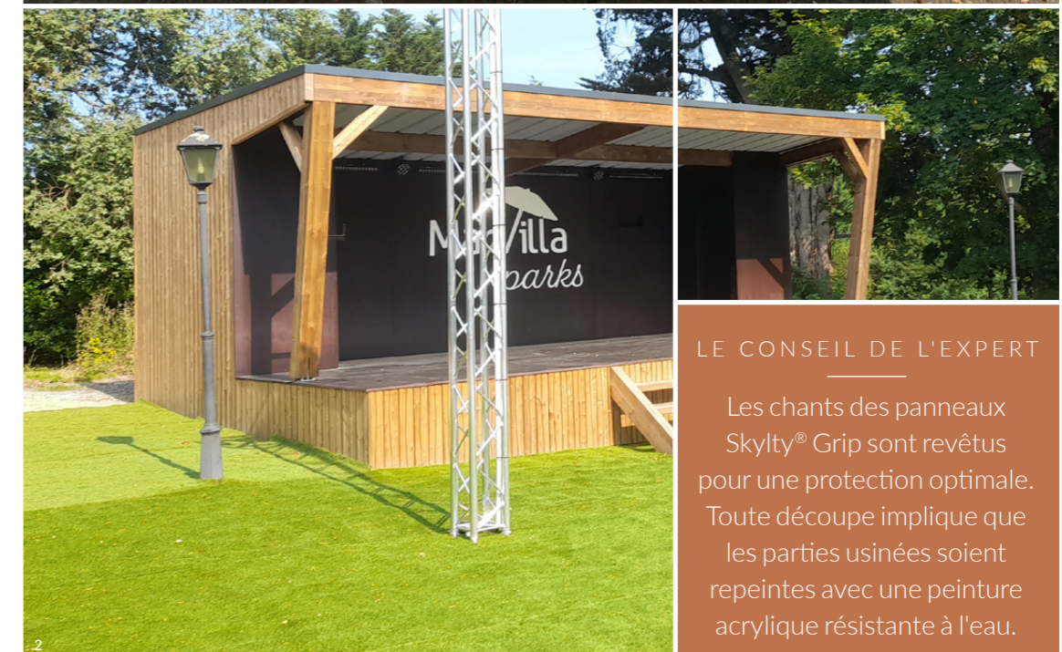
1. Plancher de remorque en Bouleau / 2. Plancher de scène en combi